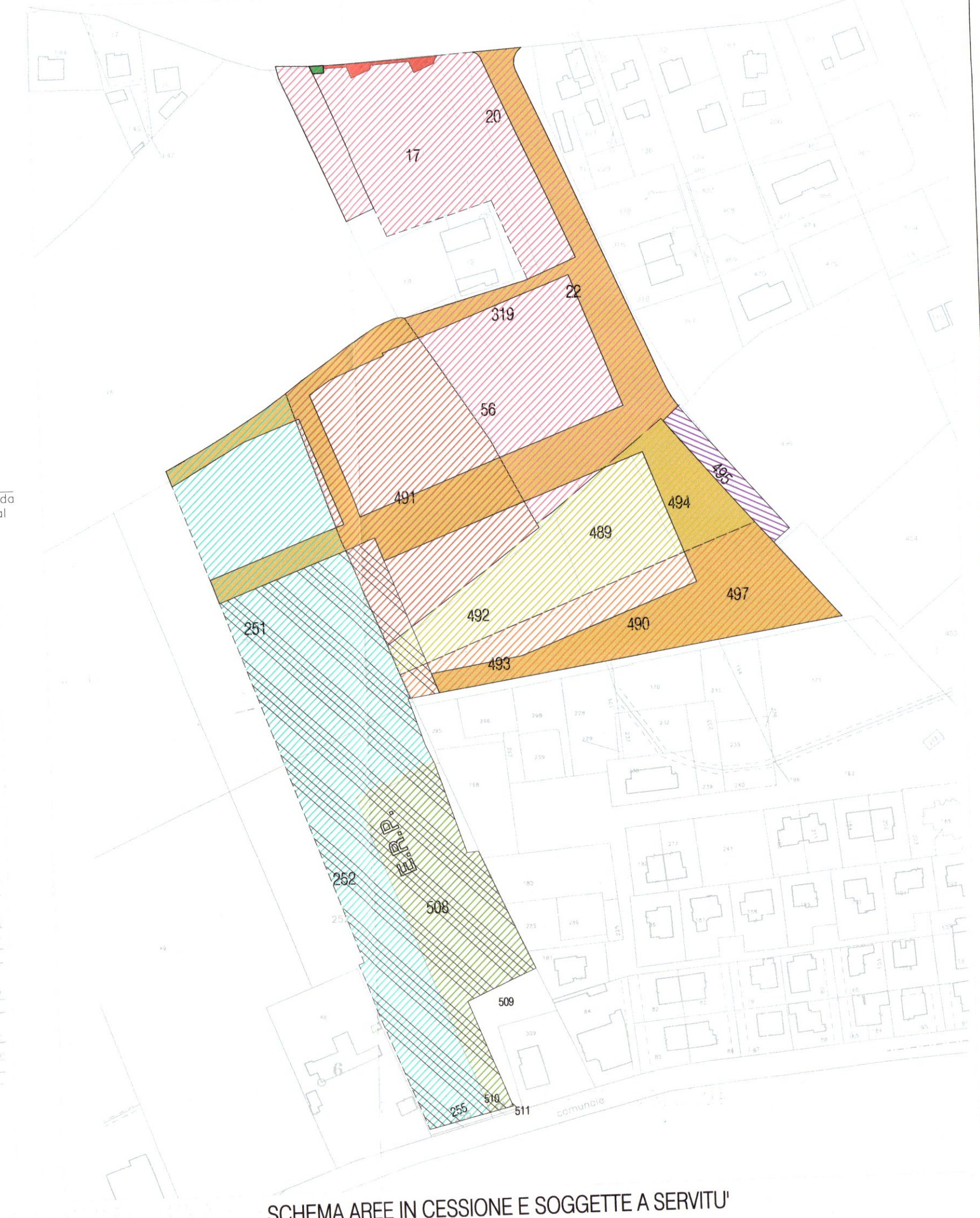
SCHEMA AREE IN CESSIONE E SOGGETTE A SERVITU'