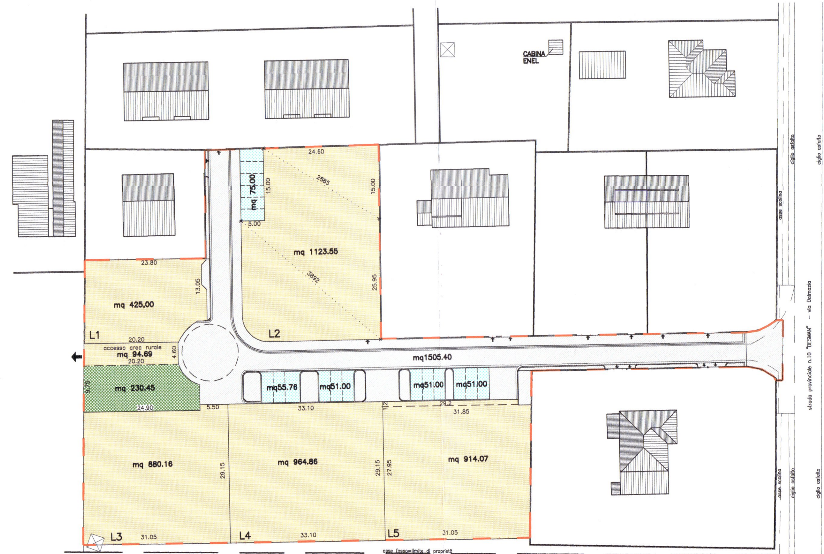
AREE DA CEDERE AL COMUNE