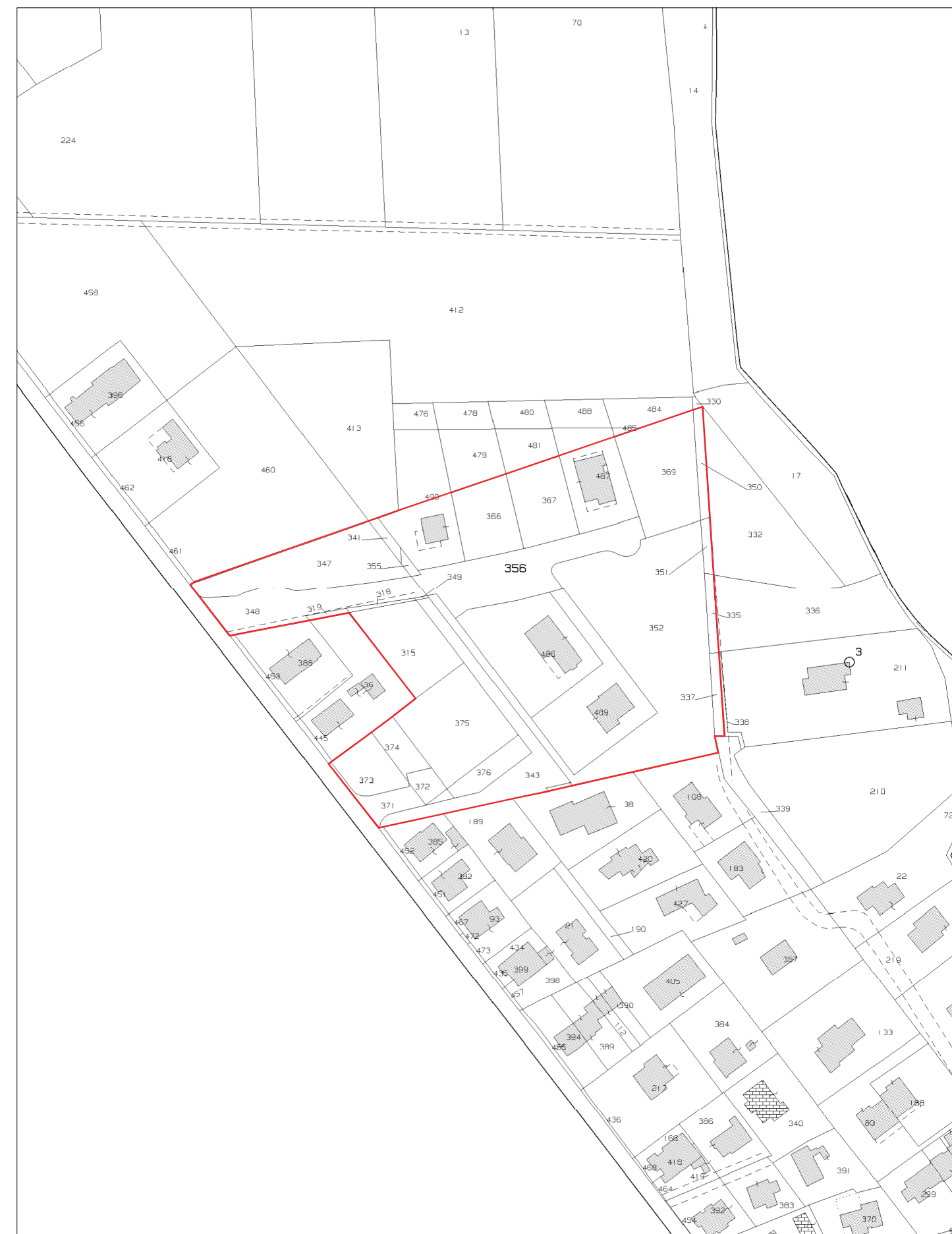
Estratto di Mappa Catastale 1:2000 Ambito di intervento